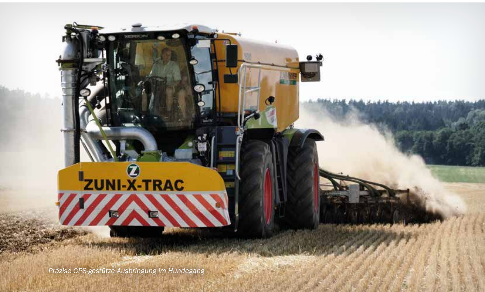
Präzise GPS-gestützte Ausbringung im Hundegang

Optimale Servicefreundlichkeit zeigt das Fahrzeug durch den komplett neu konstruierten kippbaren Tank und die neue Pumpenanordnung – so wird die tägliche Wartung auf ein Minimum reduziert.