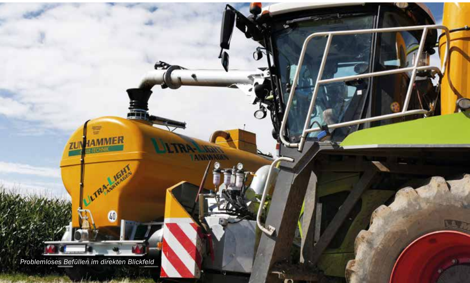
Problemloses Befüllen im direkten Blickfeld