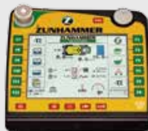
Alles auf einen Blick: Der ISOBUS Güllecomputer.